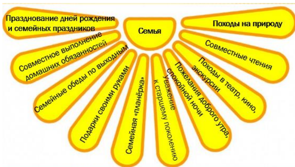
Рисунок 2. Приблизительные результаты работы

Спасибо. Вот и засияло «семейное солнышко» всеми своими лучиками. Я думаю, что вы увидели, насколько важным являются семейные традиции. Общие дела воспитывают в детях чувство ответственности, уверенности, повышают самооценку, развивают положительные эмоции, но самое важное – объединяют его с родителями, сестрами, братьями, другими членами семьи.